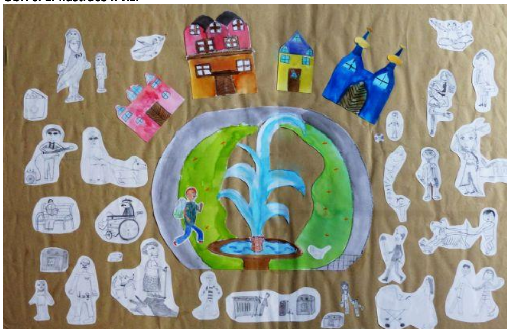
Obr. č. 1: Ilustrace k vizi

Chceme, aby Karlovarsko bylo místem příležitostí.