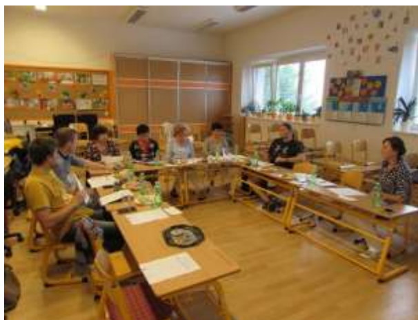
Obr. 3 Jednání pracovní skupiny ZŠ a MŠ (ZŠ a MŠ Veselá - září 2016)