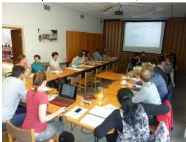
Obr. 1 Setkání akterů působících ve vzdělávání (MěÚ Vizovice - květen 2016)