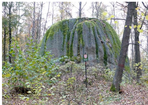
Obr.: Kynžvartský kámen

Skalní blok vzdálený 400 m severovýchodně od Lázní Kynžvart a 150 m nad Pasterbním rybníkem v Kynžvartské vrchovině o celkové výměře 0,16 ha v nadmořské výšce 610 m n.m. v k.ú. Lázně Kynžvart. Jedná se o žulový monolit s dokonale vyvinutými mikrotvary zvětrávání a odnosu (žlábkové škrapy). Původně kvádrotvítý tvar byl zaoblen na dnešní půdorys zhruba 7 x 5 m o výšce 6 m. Žlábkové škrapy mají hloubku až 60 cm a délku přes 1m. Přírodní památka byla vyhlášena v roce 1990 a nově v 1997.