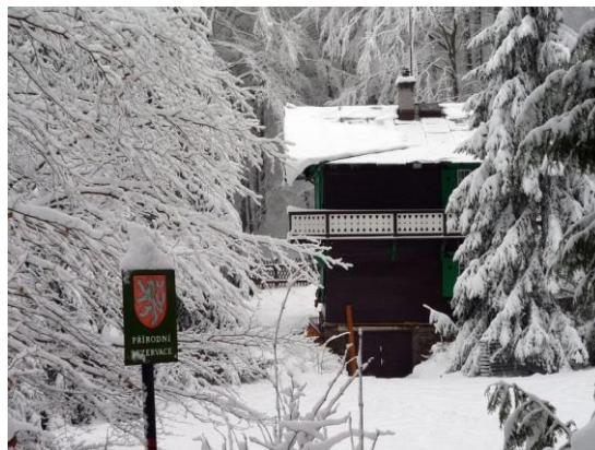
Obr.: Holina v zimě