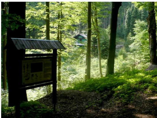
Obr.: Holina v létě

Lesní porosty na jižních svazích kóty 804,8 m n.m. v Slavkovském lese v k.ú. Lázně Kynžvart a Valy u Mariánských Lázní o celkové výměře 40,84 ha v nadmořské výšce 672 – 766 m n.m. Jedná se o květnaté a kyselé bučiny a zbytky původních přirozených lesních společenstev. Holina je v současnosti jediná rezervace ve Slavkovském lese vytvořená k ochraně květnatých bučin, původně jednoho z nejrozšířenějších typů lesní vegetace v chráněné krajinné oblasti. Územím rezervace vede turistická trasa. Přírodní rezervace byla vyhlášena v r. 1990.