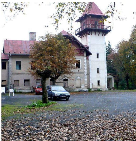
Obr.: Rozhledna Kamzík

Lázeňské rozhledny jsou zvláštní kapitolou v české rozhlednové historii. Na jednu stranu vždy k lázeňským městům patřily a svou ozdobnou architekturou byly jejich perlami, na straně druhé je až nebezpečně spojují smutné osudy. Současný objekt byl postaven v letech 1895 - 1898 na místě původního vyhlídkového altánu a jako poslední byla přistavěna právě 25 metrů vysoká vyhlídková věž. Kromě ní byly součástí areálu ještě prostorné sály, kavárna a restaurace. Postupně přibývaly další kratochvíle jako hřiště a kurty a vrch, tehdy zvaný Forstwarte, se stal jedním z nejdůležitějších míst oddechu v Mariánských Lázních. V průběhu 2. poloviny 20. století se stal Kamzík (tento název získal v roce 1956, kdy byla u objektu postavena socha kamzíka) veřejnosti přístupný a velmi oblíbený. Časy se změnily až po roce 1989, kdy se zde odehrála jedna z mnoha nezdařilých privatizací. Po ní sice ještě pár let objekt fungoval, ale roku 1997 byl opuštěn, bohužel bez strážní služby, a tak nic nebránilo mohutné devastaci a rozkradení všeho, co se ukrást dalo. Již 4 roky po ukončení provozu byly části Kamzíku v podstatě zříceninou. Současný majitel má v plánu stavbu rekonstruovat.