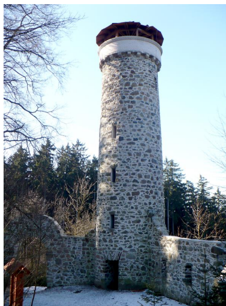
Obr.: Rozhledna Hamelika