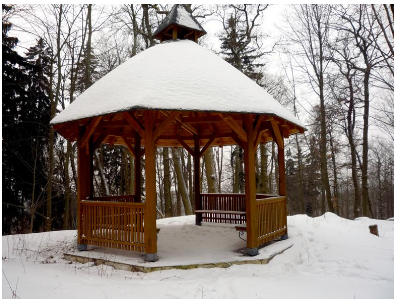
Obr.: Žižkův vrch – vyhlídka Bedřicha Viléma