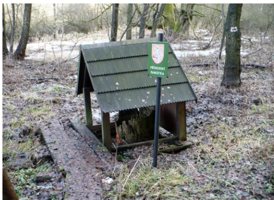
Obr.: Koňský pramen

Pramen se nachází 300 m severovýchodně od vsi Chotěnov v k.ú. Chotěnov u M. Lázní v nadmořské výšce 572 m n.m. Jedná se o vývěr uhličitě minerální vody. Pramen je zachován a upraven tak, aby návštěvníkům umožnil občerstvení minerální vodou. Okolí vývěru bylo zastřešeno. Přírodní památka byla vyhlášena v roce 1996.