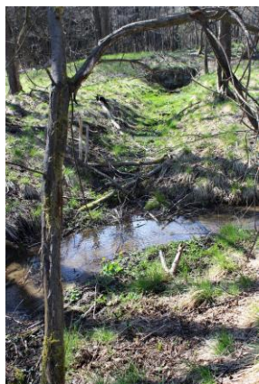
Obr.: Prameniště Teplé

Přírodní rezervace má výměru 44,89 ha, leží v nadmořské výšce 749 – 776 m.n.m a byla vyhlášena v roce 1993.