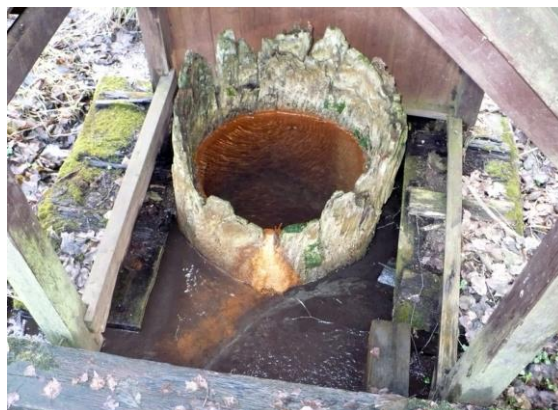
Obr.: Koňský pramen