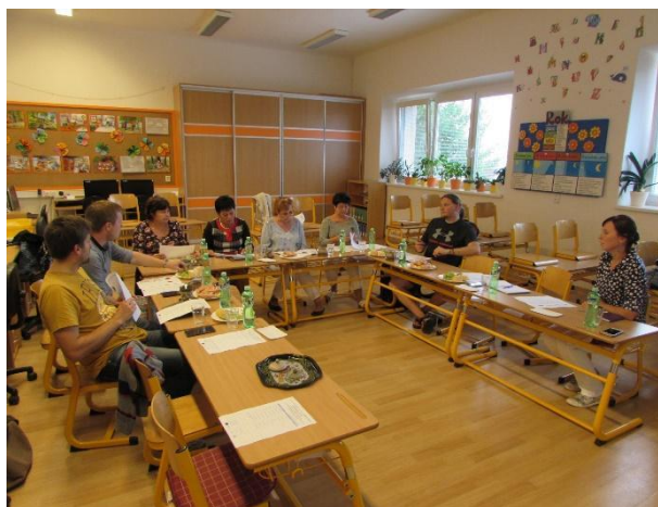
Obr. 3 Jednání pracovní skupiny ZŠ a MŠ (ZŠ a MŠ Veselá - září 2016)