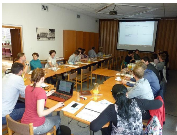
Obr. 1 Setkání aktérů působících ve vzdělávání (MěÚ Vizovice - květen 2016)