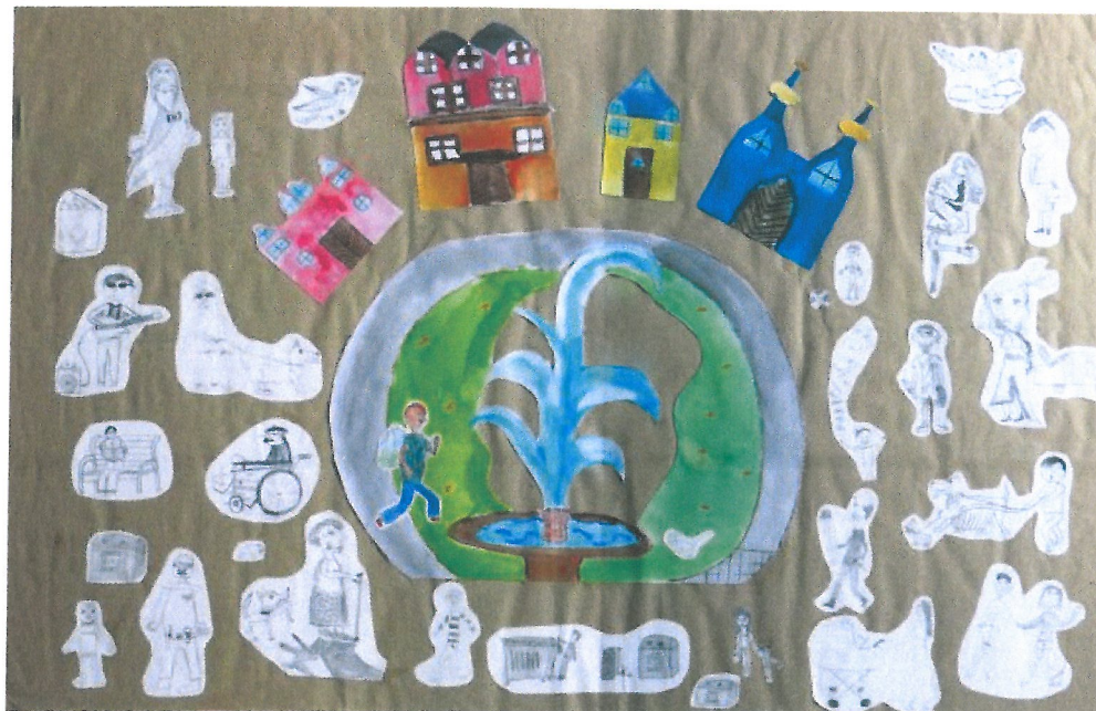
Obr. č. 1: Ilustrace k vizi

Chceme, aby Karlovarsko bylo místem příležitostí.