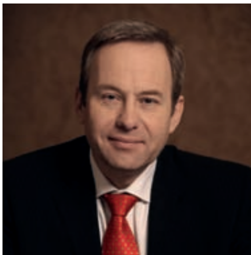
Ministr pro místní rozvoj Ing. Rostislav Vondruška