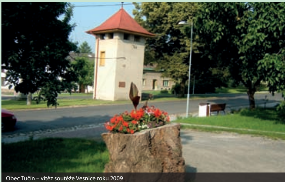
Obec Tučín – vítěz soutěže Vesnice roku 2009

Peníze slouží vítězným obcím především na opravu komunikací, budování kanalizace, rekonstrukci budov, ale i na činnost spolků a rozvoj místních tradic.