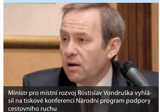
Ministr pro místní rozvoj Rostislav Vondruška vyhlásil na tiskové konferenci Národní program podpory cestovního ruchu

Informace o programu a dokumenty potřebné k předložení žádosti o dotaci jsou k dispozici na http://www.mmr.cz/Cestovni-ruch/Programy-Dotace/Narodni-program-cestovniho-ruchu .