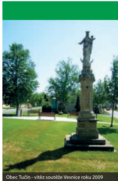
Obec Tučín - vítěz soutěže Vesnice roku 2009

Více informací o programu Bezbariérové obce mohou zájemci najít na adrese: http://www.mmr.cz/Regionalni-politika/Programy-Dotace/Podpora-pri-odstranovani-barier-v-budovach-pro-rok .