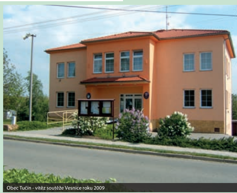
Obec Tučín - vítěz soutěže Vesnice roku 2009

Kancelář prezidenta republiky, Ministerstvo životního prostředí, Ministerstvo kultury, Společnost pro zahradní a krajinářskou tvorbu, Svaz knihovníků a informačních pracovníků, Folklorní sdružení ČR, Sdružení místních samospráv ČR.