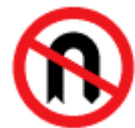
no U turn