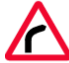
bend to right