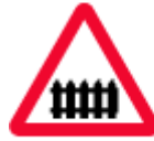
level crossing with barrier