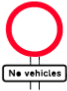
No vehicles except bicycles being pushed