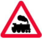
level crossing without barrier