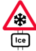
risk of ice